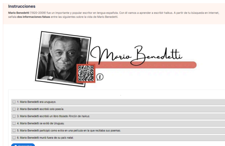
Figura 02: print del ejercicio